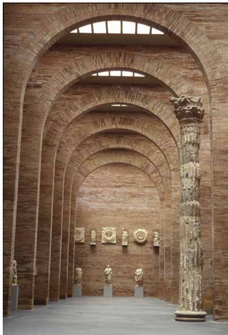
7. Interior del Museo Nacional de Arte Romano de Mérida (Foto: M. de la Barrera Ocaña. Archivo del Museo Nacional de Arte Romano de Mérida).

Muchas veces he comentado con Rafael Moneo su relación con mi padre y él me ha expresado su sentido afecto por su figura, al valorar en él el trabajo honrado, sistemático y su bondad y sencillez, las cualidades más definitorias de su carácter.