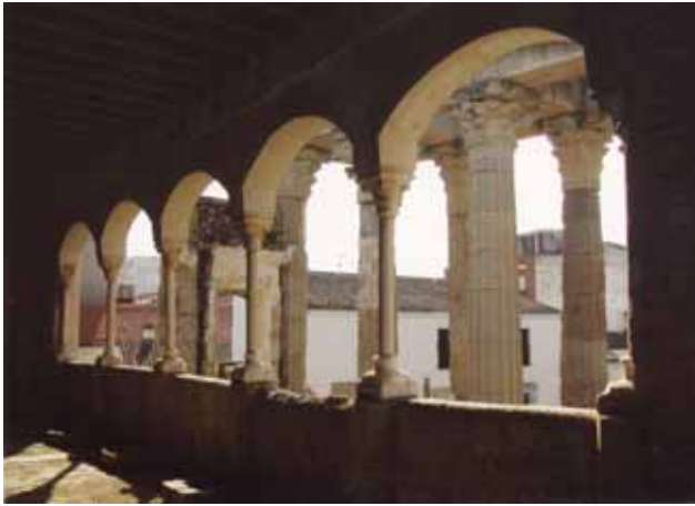
3. El Palacio del Conde de los Corbos ubicado en el antiguo «Templo de Diana».

Las visitas al museo fueron creciendo, pero no de la manera que era de desear, pues como él decía: «Era preciso que el Museo buscara al público». Por ello, desde entonces ya comenzó a considerar la posibilidad de construir algún día el nuevo edificio frente al teatro romano, en el «Solar de las Torres». Eran, por entonces, estos deseos verdaderas quimeras.