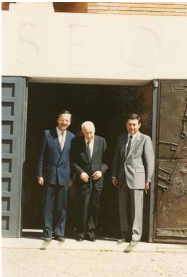
6. Con Rafael Moneo y el autor de este artículo en la puerta del Museo Nacional de Arte Romano de Mérida el día de su inauguración.