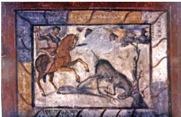
8. Cuadro pictórico con escena cinagética, descubierto en la emeritense calle de Suárez Somonte.