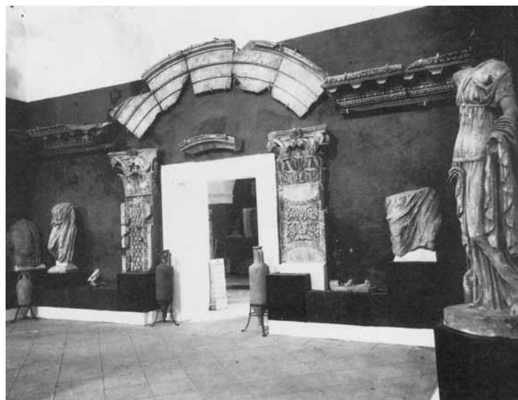
2. Instalaciones de la iglesia de Santa Clara.