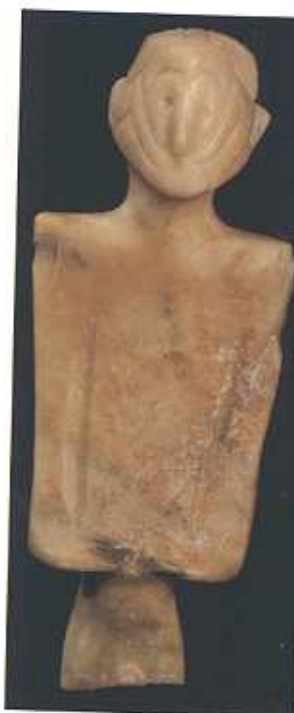
Ídolo antropomorfo. Rena. (F.V.N.)

A través de las piezas expuestas vemos el contacto con griegos y fenicios, denominado periodo orientalizante. En esta época el alumno puede comprobar un paso más en la evolución tecnológica que había comenzado en la