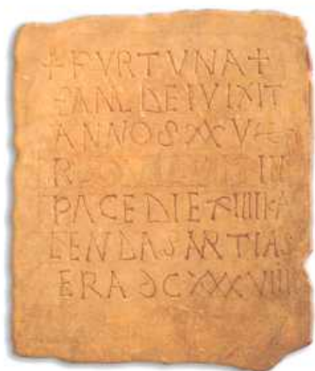
Lápida dedicada a Fortuna, Mérida año 601. (A.T.)

Representa el final del imperio romano y el comienzo del periodo visigodo. Tiene una sola vitrina que hay que mirar de derecha a izquierda, siendo las primeras piezas romanas y las últimas visigodas.