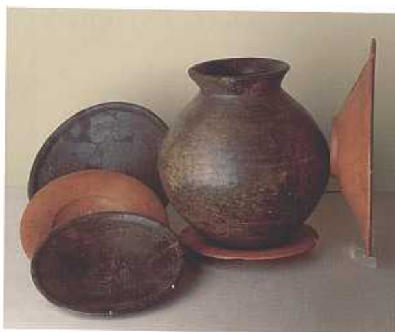
Conjunto de cerámica de una tumba de la necrópolis de Medellín, siglo VII-VI a.C. (F.I.A.)