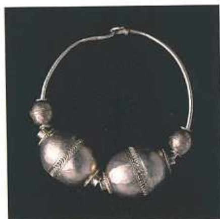
Pendiente, plata, Nogales, siglo XIV. (F.M.A.)