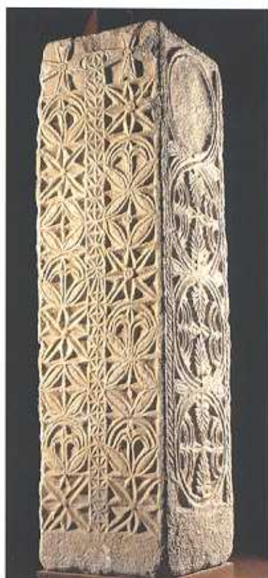
Pilar mármol, Badajoz, siglos VI-VII. (F.V.N.)

Pueden verse cimacios, canceles, pilares, columnas, pilastras, etc. que formarían parte de distintas edificaciones.