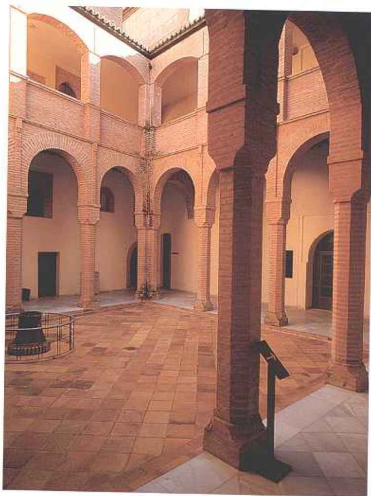
Palacio de los Duques de la Roca. Patio restaurado. (F.I.A.)

Tras la aclaración de los contenidos curriculares que se pueden trabajar en el museo, mostramos ahora un resumen de los aspectos más destacados de cada sala con la intención de colaborar con el profesor para orientarle en la visita y facilitarle una explicación previa a los alumnos sobre lo que podrán contemplar en el museo.