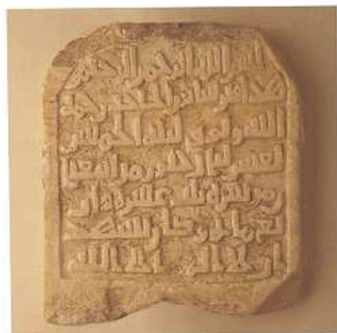
Lápida de Sapur (muerto: 1022), Badajoz. (F.I.A.)