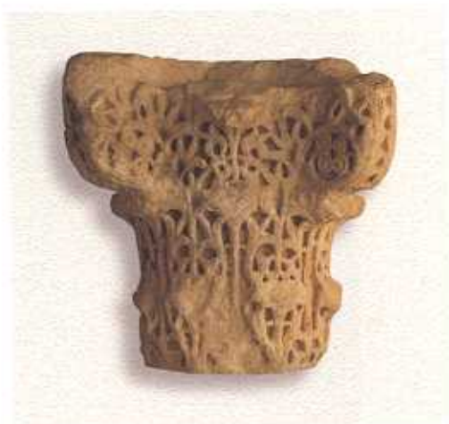
Capitel califal, siglo X. (F.I.A.)

Pero, la verdadera muestra de la presencia islámica en Badajoz es La Alcazaba y la torre octogonal de Espantaperros.