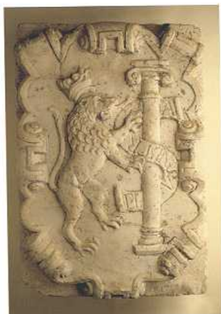
Escudo de Badajoz, Puente de Palmas, Badajoz, 1596. (F.I.A.)

En cuanto a la cerámica, se utilizaban gran cantidad de piezas que pueden verse en una de las vitrinas tales como cántaros, jarros, morteros, bacinillas, etc. Esta cerámica representa de manera significativa el ajuar doméstico utilizado en este momento.