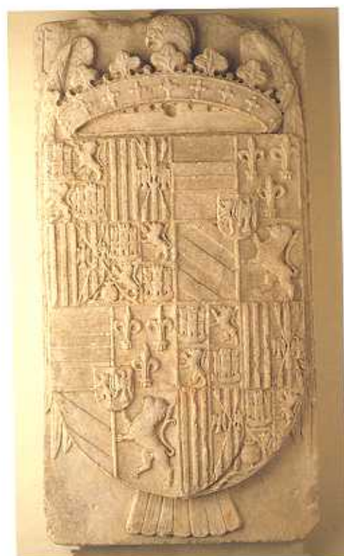
Escudo de doña Juana I de Castilla y de Felipe de Borgoña, su consorte, año 1506. (F.I.A.)