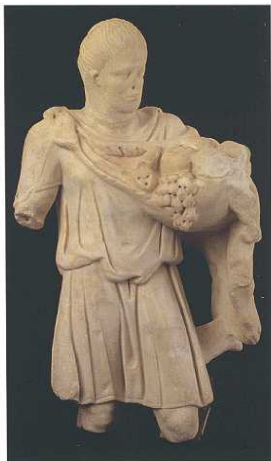
Estatua de Silvano, Talavera la Real, siglo I. (F.L.)

Hay expuestos dos mosaicos, uno en el vestíbulo (mosaico de Orfeo) y otro en el patio (mosaico octogonal); ambos son figurativos y representan escenas mitológicas.