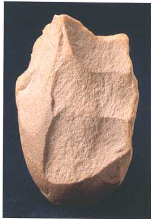
Triedro, Paleolítico Inferior, Orellana. (F.V.N.)

Útiles de Paleolítico. aparecidos en la Cuenca Media del Guadiana, los primeros útiles sobre núcleos (bifaces, cuchillos, hendedores); los segundos sobre lascas (raspadores, raederas, denticulados, etc...). Algunos fragmentos de cerámica del Neolítico, aparecidos en la Cueva de La Charneca, en Oliva de Mérida.