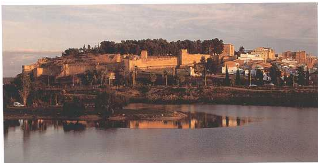
Vista general de la Alcazaba de Badajoz. (F.I.A.)