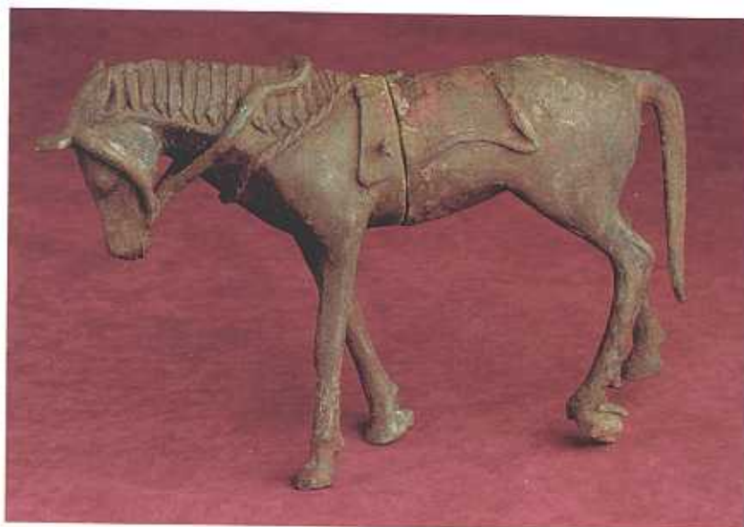
Caballo, bronce, Cancho Roano (Zalamea de la Serena), siglo V a.C. (F.I.A.)