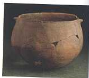
Vaso semiestérico. Calcolítico. El Lobo, Badajoz. (F.I.A.)