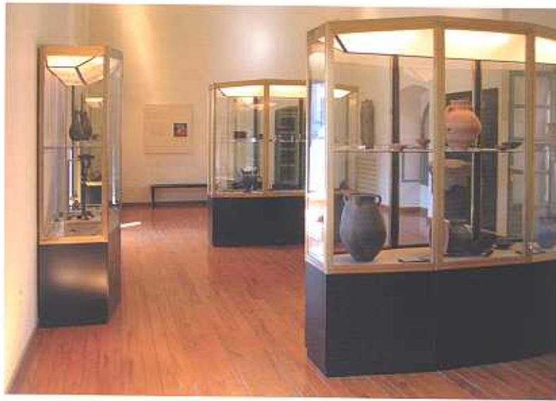
Sala Protohistoria. (F.A.T.)