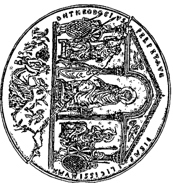
Disco del emperador Teodosio padre de Arcadio y Honorio. Hallado en Almenralejo (Badajoz)