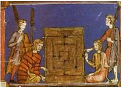
Alquerque de 9 ilustrada en el Libro de los Juegos. Siglo XIII

El alquerque es uno de los juegos de mesa más populares jugados en la Edad Media. El nombre alquerque procede del árabe "al-qariq" (sitio plano), que según algunas investigaciones fueron los encargados de difundirlo por la Península Ibérica. Pero parece que su origen es muy anterior, se han encontrado juegos de este tipo grabados en restos de época romana e incluso se encuentran registros de este juego incluso de época egipcia.